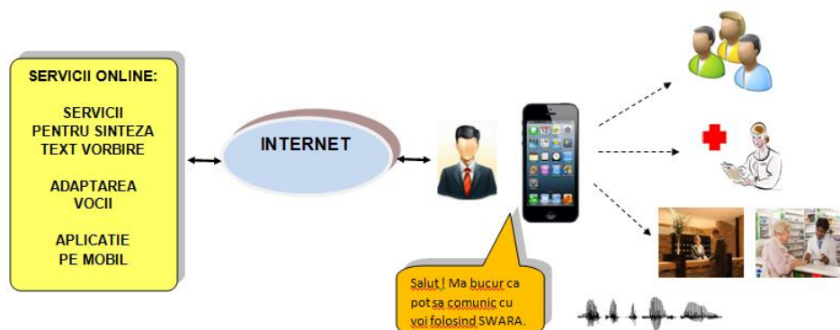
Figura 1.1. Schema generală a sistemului propus

SWARA (Sistem Mobil de Asistare Vocală în Reintegrarea Persoanelor cu Afonii Chirurgicale) va dezvolta un sistem de sinteză text-vorbire asistiv, rapid și eficient pentru pacienții laringectomizați, fapt ce le va permite să interacționeze cu restul persoanelor într-o manieră cât mai apropiată de cea naturală, folosind o voce personalizată.